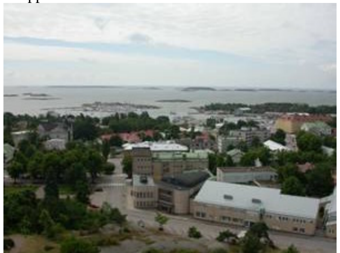
Utsikt från vattentornet

Hangö är en liten fin stad med två hamnar, en på norra sidan av halvön och en på den södra sidan som också är den största. Själva stan ligger uppe på en höjd där kyrkan och vattentornet finns. Man kan besöka vattentornet och via en hiss komma ända upp. Därifrån kan man se hela skärgården med inloppet och den södra hamnen.