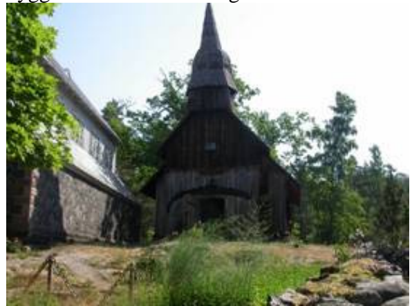
Kyrkorna på Ruhnu

På Ruhnu finns av ett mindre samhälle med en handfull hus en bit in på ön och en del utspridda. Den gamla kyrkan med svensk klingande namn på kyrkbänkarna finns där. En ny kyrka har byggts alldeles intill den gamla.