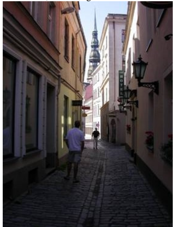
En gränd med Peterskyrkan i bakgrunden

Vi besökte i huvudsak den gamla delen och gjorde enbart ett kortare besök i den moderna delen. I den gamla delen finns mest små butiker och stånd där man säljer hantverk och souvenirer, men också gott om restauranger. Den gamla ringmuren finns endast kvar på några få ställen. Många av husen är renoverade, men många är också under renovering.