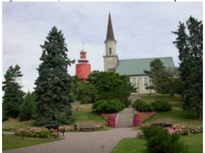
Hangö kyrka och vattentorn

Väl där var det inga problem med inklareringen, men sen var det att ta sig till marinan. Det var väldigt mycket master, så vi undrade om vi skulle få plats.