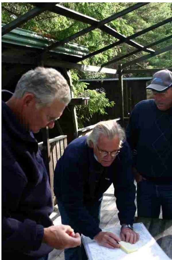
Här bestäms gemensamt routen för årets KM-segling