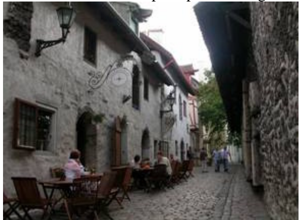
En italiensk restaurang där vi fick plats

Hela den gamla stan är under renovering även om mycket och många hus redan är åtgärdade. Även denna stad hade många restauranger och småbutiker för souvenirer och hantverk. Det är mycket folk i rörelse och svårt att få plats på serveringarna.