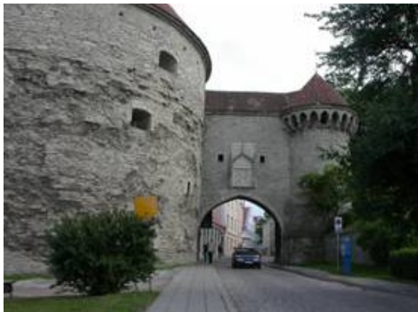
Tjocka Berta det största tornet på hela ringmuren numera ett marinmuseum

På vägen passerade vi det kalkbrott där den mesta stenen var hämtad till Tallinns uppbyggnad både nu och förr i tiden. Nu är där en förort med över hundra tusen invånare och liknar vårt Rinkeby och Tensta. Denna del av stan syns långt ut till havs liggande ovanför Tallinns andra kända landmärken. Vi spenderade mycket tid åt att vandra runt i det gamla Tallinn och äta där.