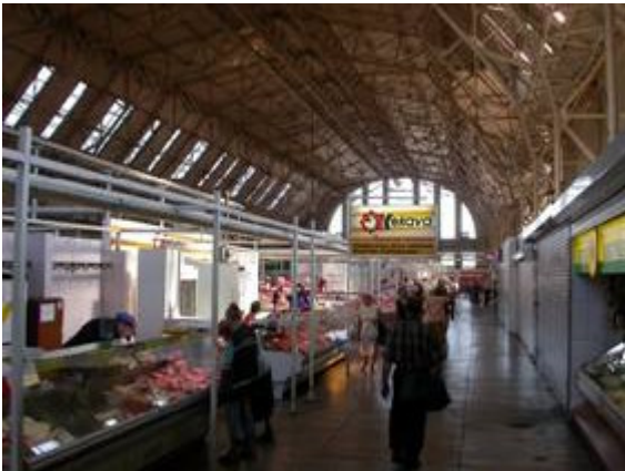
Saluhall i zeppelinehangar

Marknaden vid de stora zeppelinehangarerna är också värt ett besök inte bara ur studiesynvinkel, man kan göra en del av provianteringen där.