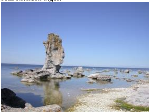
Raukar på Fårö

Det gavs tillfälle till promenader längs stranden bort mot raukarna. Här blir man förvånad över den växlighet som lever bland all den kalksten som stranden utgör.