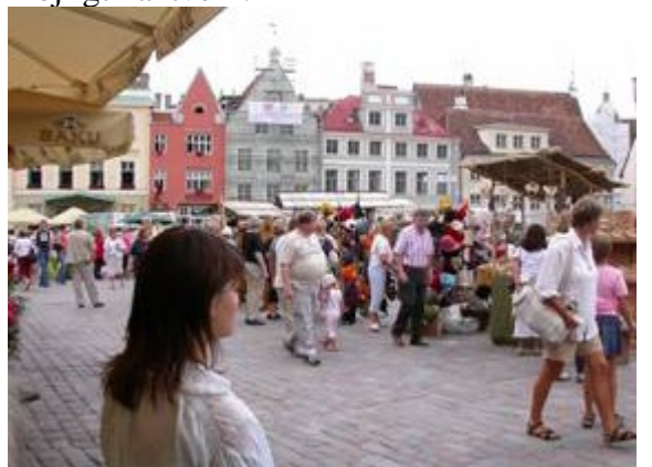
Marknad på rådhusorget

Den gamla stan ligger delvis på en kulle och har med sin ringmur aldrig fallit i fienders händer under medeltiden. Det syns också när man står utanför och ser den höga och kraftiga muren att den är svårforcerad. Vi var där i tre dagar och det var marknad varje dag på rådhusorget där man sålde allt möjligt hantverk.