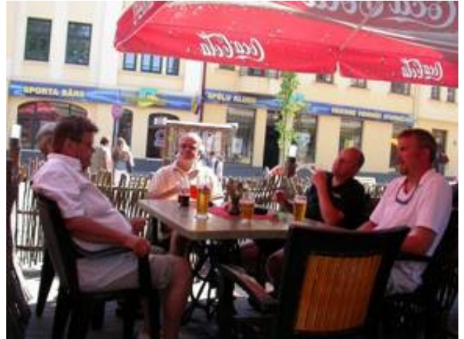
En öl i Ventspils

Vid stråket hittade vi en uteservering som tilltalade oss där vi smakade på ölen och maten.