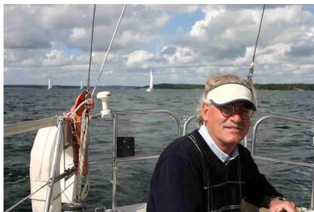
Här känner Poseidons skeppare sig trygg med konkurrenterna långt efter.

Det sägs att segrarna skriver historien. Just här råkar det vara sant.