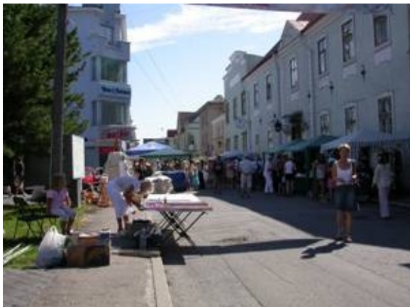
Marknad i Pärnu

Marinan ligger tio minuters promenad från stan. Pärnu är en stad med sommarkaraktär, den är känd för sina fina sandstränder och används flitigt av Estländarna. Staden är gammal och även denna har kvar delar av sin ringmur. Staden finns på bägge sidor av floden, men den gamla delen finns på den södra sidan.