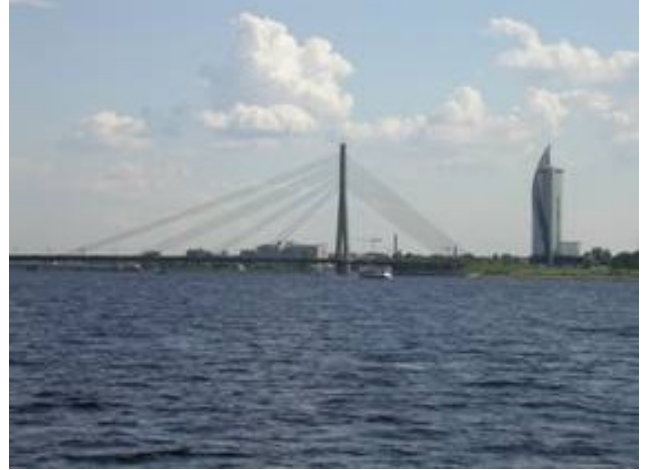
Vy från inloppet till Yacht Centre Andrejosta

Det är centralt med bara 15 minuters promenad in till stan, eller man kan gå tvärs över gatan och ta spårvagnen. Hamnen är bevakad med nattvakt och hamnkaptan under dagen. Man har tillgång till el, vatten, dusch och toaletter, men även en bassäng och en bar, allt annat måste inhandlas på stan.