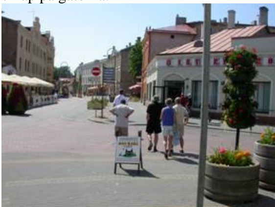
Gata i Ventspils

Ventspils är en fin liten stad med gamla och lite nya hus och med ett affärscentrum som inte heller är stort. Gatorna är rena och verkade nysopade, ingen tycks slänga skräp på gatorna.