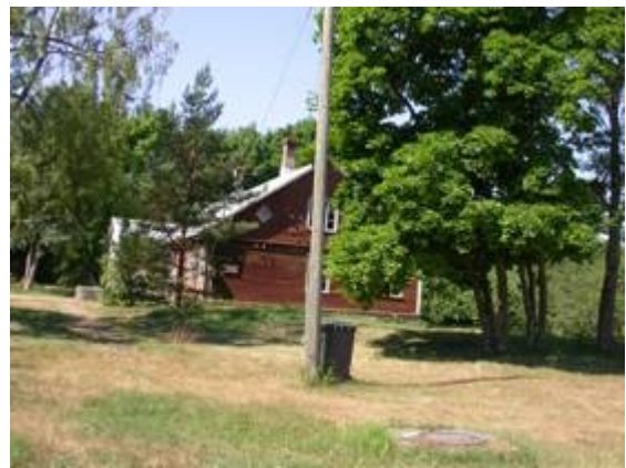
En gård på Ruhnu