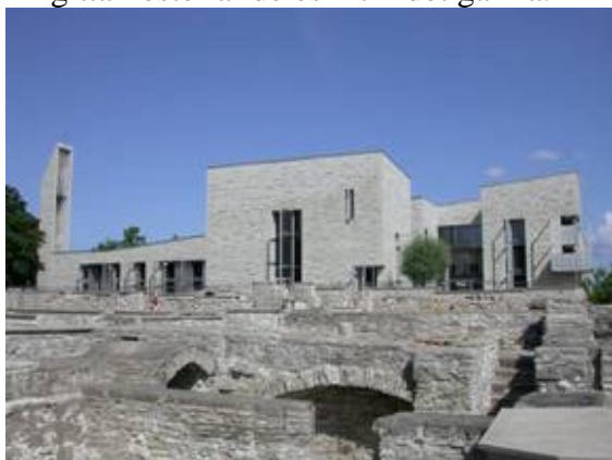
Det nutida Birgittaklostret

Det finns numera också ett modernt Birgittakloster alldeles intill det gamla.