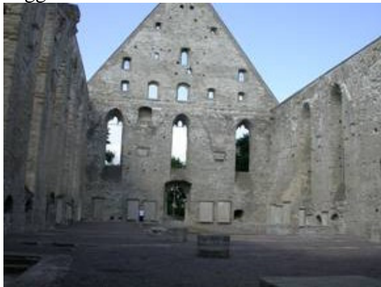
Birgittaklostrets huvudskepp i Tallinn

Mitt emot marinan på andra sidan huvudvägen ligger de enorma ruinerna efter "Birgitta klostret". Man ser hur stort det är när man jämför med Solasters besättning den vita pricken längst ner intill väggen.