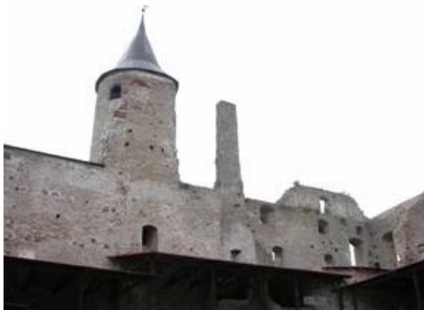
Fästningen i Haapsalu

Vi tog en 20 minuters promenad in till stan och konstaterade att vi missat "medeltidsfestival" som just avslutades. Festivalen hade hållits i den medeltida fästning som fortfarande är till största delen intakt.