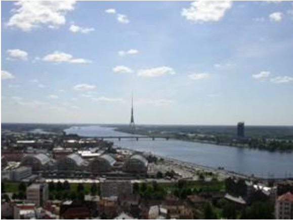
Vy från Peterskyrkans torn mot zeppelinehangarerna och teletornet

Bara ett par kvarter därifrån ligger ”Domtorget” med domkyrkan som har en av världens största orgel med 6718 pipor. Kyrkan har flera fönster i glasmosaik och ett föreställer Kung Gustav II Adolfs intåg i Riga.