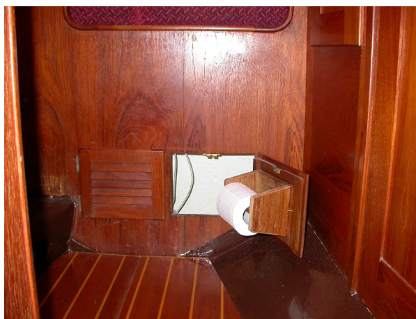
Så här ser det ut med öppen lucka