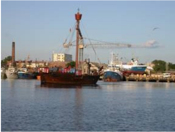
En medeltida kogg angör Ventspils

Inklarering skedde i hamnkontorets lokaler vid hamnen. Proceduren var inte ett dugg besvärlig och vi lärde oss att den blankett som svenska kustbevakningen använder duger bra här också. Det viktiga var att ha en "crew list" som specificerade personerna ombord med passnummer, båtens namn, hemmahamn och från vilken närmaste hamn man kom ifrån.