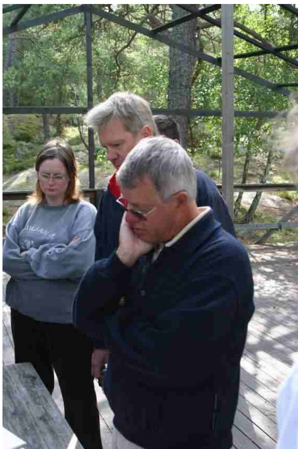
Skepparmöte ute i det fria