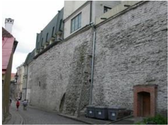
Gammalt och nytt integrerat

delen först där vi bekantade oss med ringmuren som är väl bevarad.