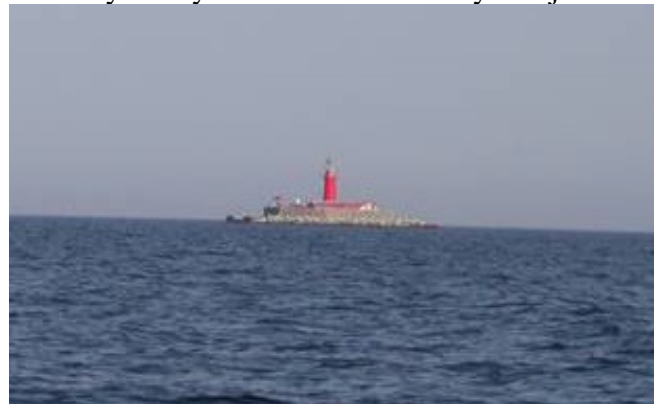
Kolka fyren på distans

Solaster lämnade Ventspils vid midnatt för att passa tiden för besättningsbyte i Riga. Det är nya 70 nm att segla utmed den Lettiska kusten som inte är svårnavigerat. Vindarna var västliga, så det var bara att följa med halv vinden upp till inloppet till Rigabukten, Där man håller ut för grundpartierna. På morgonkulan passerar vi Kolka fyren styr söder ut mot fiskebyn Roja.