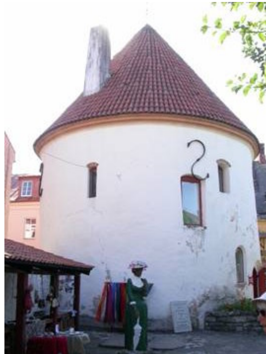
Ett gammalt fångelse torn omgjort till affär och ateljé

Mest handlade det om matstånd med uteservering av olika slag. Även en del mer underhållning av typen "Galenskaparna" och roddtävling på floden bjöds det på. Som marinagäst var inträdet gratis. Det är långt till affärer så det blev en del kånkande med färskvaror.