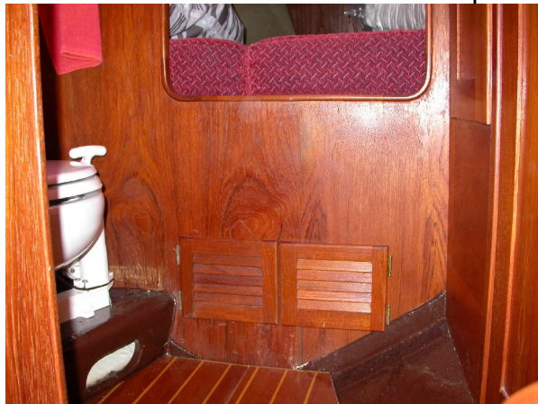
Så här ser det ut med stängda luckor

Det finns standardluckor i teak att köpa.