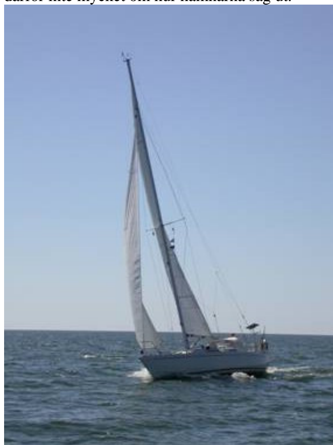
Sophie på väg mot Ventspils

Klockan 3.00 gav vi oss iväg och vårt mål var Ventspils i Lettland som är den närmaste hamnen ca: 90 nm. Spänningen ombord på Solaster var stor för vi hade aldrig varit i Baltikum och visste därför inte mycket om hur hamnarna såg ut.